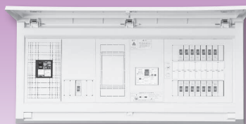
パールテクト(扉付)