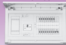
パールテクト(扉付)