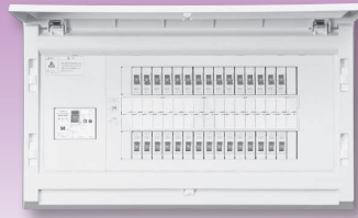
パールテクト(扉付)埋込形